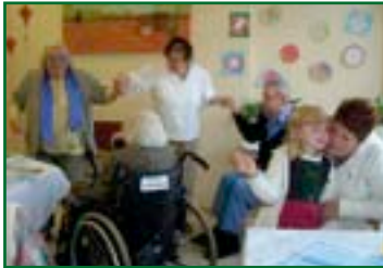
Spaß für Jung und Alt: das alljährliche Oktoberfest.