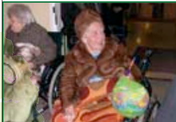
Ein Highlight im Terminkalender: der Martinszug mit Wecken, Glühwein und Kakao.

Es stehen aber auch regelmäßig Ausflüge in die nähere Umgebung auf dem Programm. Diese werden mit einem eigenen Fahrdienst realisiert, der auch für Einkäufe zur Verfügung steht.