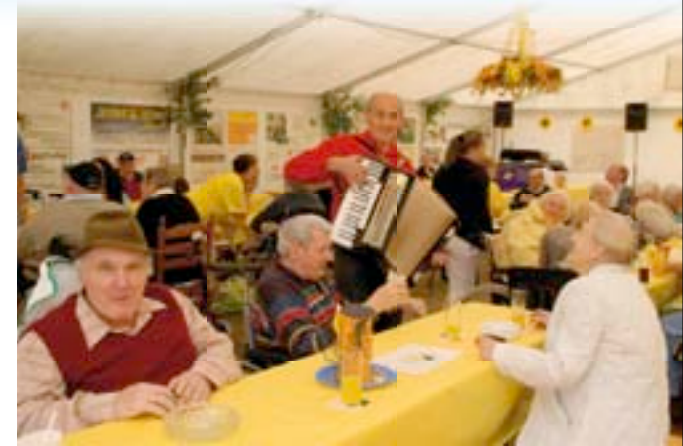
Das Sommerfest sorgt für Stimmung und gute Laune.

Fester Bestandteil sind zahlreiche Veranstaltungen, wie Oktoberfest und Martinszug, die die Mitarbeiter selbst ausrichten. Auch Gäste von außerhalb sind herzlich willkommen.