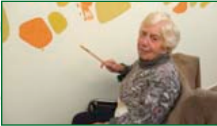
Bei der Wandbemalung bewiesen die Bewohner ihr Kunsttalent.