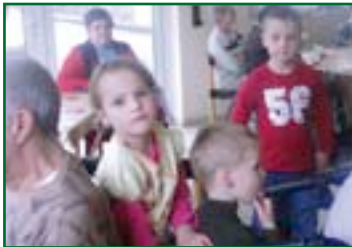
Ein Zauberer begeisterte die Bewohner und ihre Liebsten.