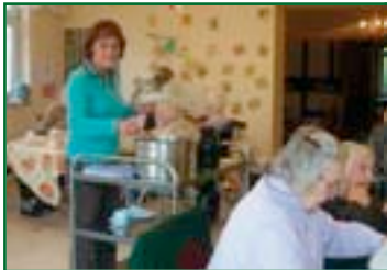
Das Essen ist ein wichtiger Bestandteil des Zusammenlebens.

Gerne sind wir bei der Planung, Vorbereitung sowie bei Behördenfragen für Sie da!