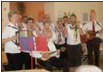
Harmonica Sound aus Euskirchen begeistert die Bewohner.