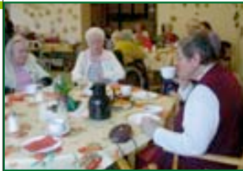
Immer wieder ein Spaß: das gemeinsame Geburtstagsfeiern.

Das Programm umfasst zum Beispiel evangelische und katholische Gottesdienste, den Einkaufsbummel in einer Boutique und bunte Nachmittage für gesellige Stunden.